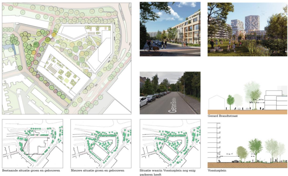
Figuur 6 Vossiusplein