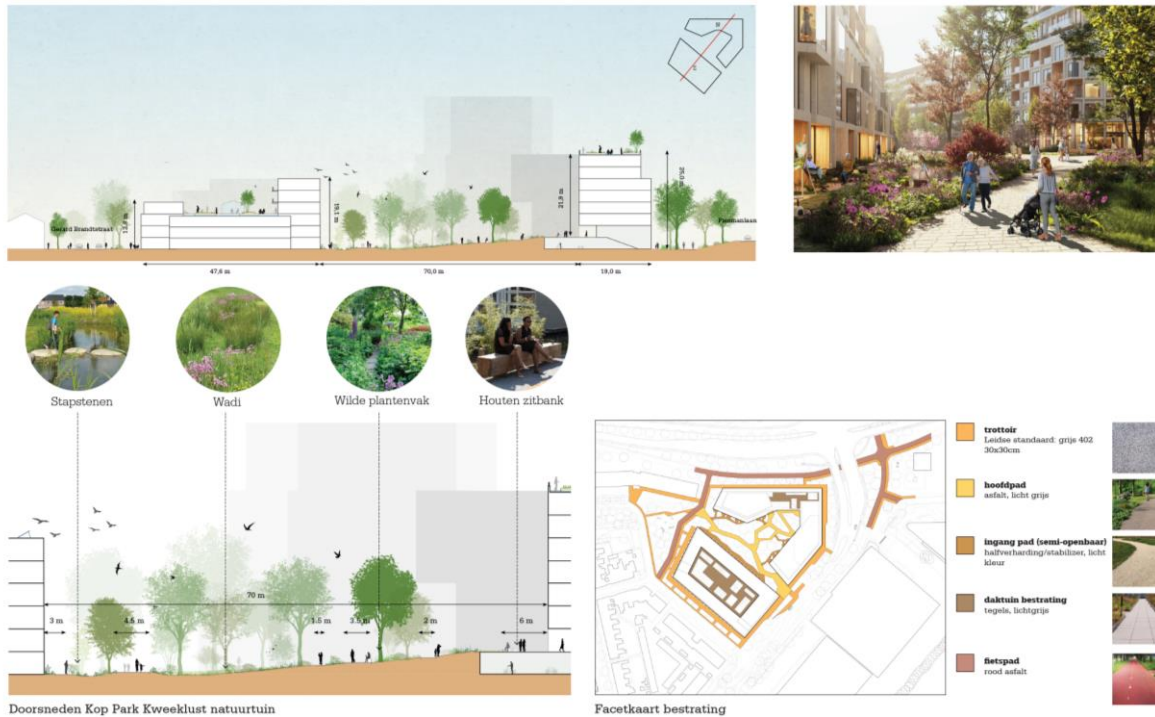
Figuur 5 Kop park kweelust en natuurtuin