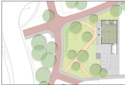
Landschapsconcept rond het paviljoen