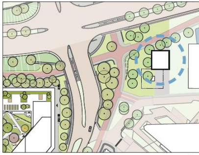
Positie van het paviljoen