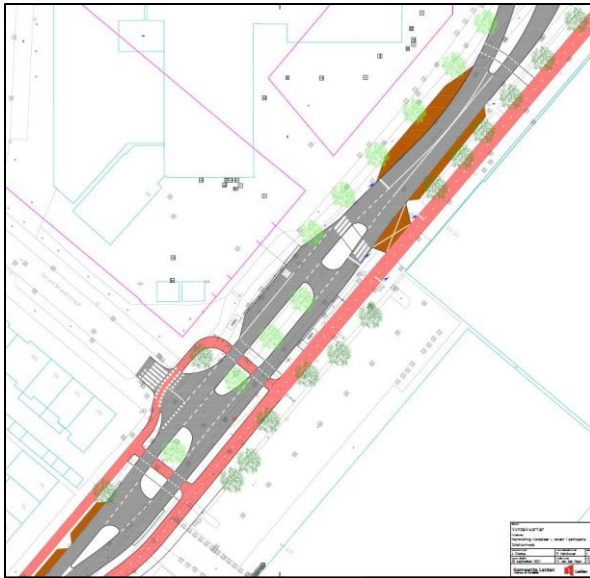
Figuur 1 Schetsvariant 1 Vondellaan