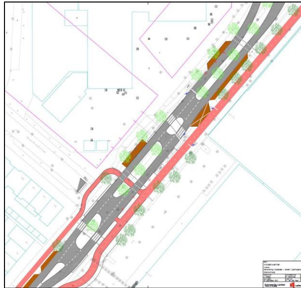
Figuur 2 Schetsvariant 2 Vondellaan